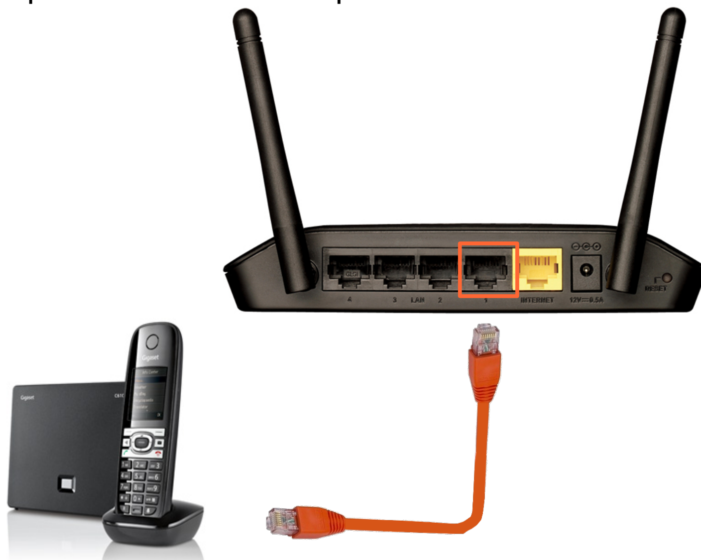
Цифровой IP телефон Gigaset S610A IP (в качестве иллюстрации)

Для подключения цифрового IP телефона, соедините Ethernet кабелем порт 1 маршрутизатора и порт базового блока вашего телефона: