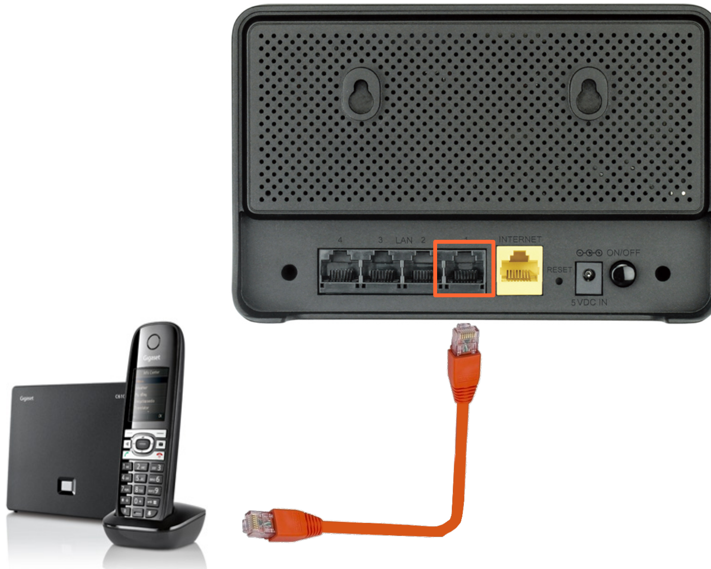
Цифровой IP телефон Gigaset C610A IP (в качестве иллюстрации)

Для подключения цифрового IP телефона, соедините Ethernet кабелем порт 1 маршрутизатора и порт базового блока вашего телефона: